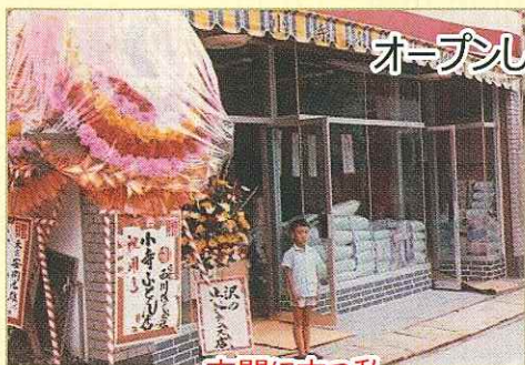
オープンした二代目勝山店