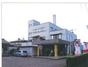
鯖江店 鯖江市丸山町 2丁目8-23 ☎(0778) 52-7570