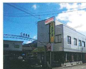
勝山店 勝山市沢町 2丁目1-4 ☎(0779)88-0670