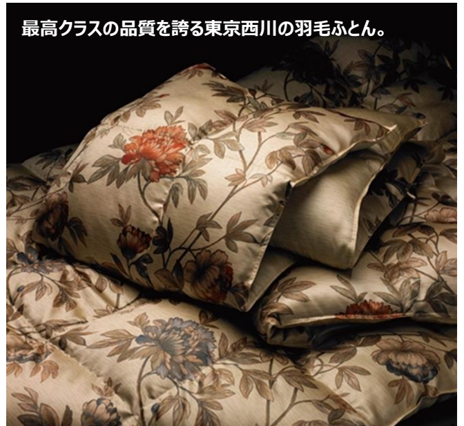
最高クラスの品質を誇る東京西川の羽毛ふとん。